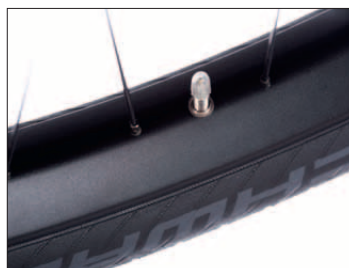
Damit der fette Reifen in der Kurve oder im Wiegetritt nicht wegnickt, läuft er auf stabiler DT Swiss-Felge mit 40 mm Maulweite.